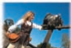
7 - Provins