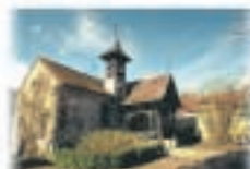
8 - Barbizon