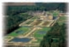
6 - Vaux-le-Vicomte