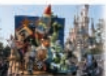
2 - Disneyland® Paris