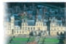
9 - Fontainebleau