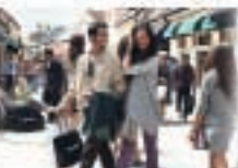
2 - La Vallée Village