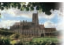
1 - Meaux