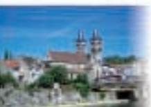
5 - Melun