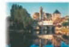
10 - Moret-sur-Loing