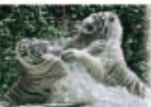
3 - Parc des félins